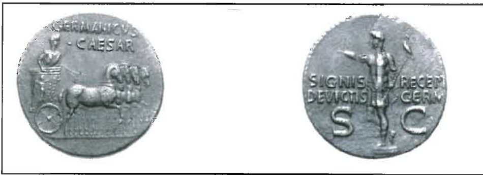
Op de hierboven afgebeelde dupondius (16,92g) met op de voorzijde het opschrift: -GERMANICUS CAESAR -, zien we Germanicus in zijn triomfsquadriga. De keerzijde met het opschrift: -SIGNIS RECEPT(us)/ DEVICTIS GERM(anis)/ S.C.- vertelt ons dat de eretekens (van de verloren legioenen uit de Varusslag) zijn teruggekeerd. Deze munt is geslagen met toestemming van de Senaat.

In deze provincie ontmoette hij de hem vijandiggezinde Romeinse Gouverneur-consul Gnaeus Calpurnius Piso. Deze persoon verzette zich openlijk tegen Germanicus. Volgens Tacitus liet Piso (in opdracht van Tiberius) Germanicus vergiften. Na een lang ziektebed stierf Germanicus in Antiochië in 19AD, uiteindelijk 34 jaar oud. Het nieuws van zijn dood schokte de Romeinse natie en een periode van rouw werd afgekondigd. Germanicus werd in Antiochië gecremeerd en de urn, werd door zijn vrouw Agrippina naar Rome gebracht en bijgezet in het Mausoleum van Augustus. Agrippina eiste gerechtigheid voor haar vermoorde man. Piso werd teruggeroepen naar Rome in 20 AD en door de Senaat aangeklaagd voor zijn daad. Als gevolg van deze beschuldiging pleegde Piso later zelfmoord.