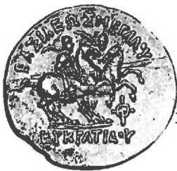
Eukratides I (± 171-145 BC), AR Tetradrachme (16,65 g), buste n.r./ Dioskuren rijdend n.r.