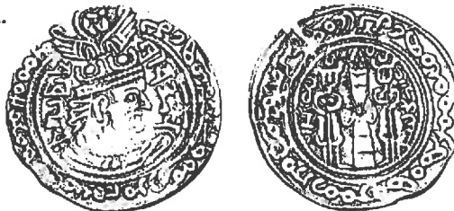
NEZAK HUNS. Sahi Tigin. After 677 AD. AR Drachm (3.44 gm). Bust imitating Khusro II right; Brahmi legends in fields, Baktrian legend around rim / Fire altar with attendants; Pahlevi legends in fields, Baktrian legend around rim.

Zijde was al lang niet meer het enige product dat verhandeld werd. Naast handelswaar waren ook ideeën en religies die met de handelaren meereisden. Via de handelsroutes werden het Boeddhisme, Zoroastrisme en Nestorianisme verspreid. Met name het Boeddhisme wist zich vanuit Vandaar (het hart van het Kushanarijk, in het huidige Noord-Pakistan) te verspreiden. In de 3de eeuw kwam er in China een einde aan de Han-dynastie, het Kushanarijk en Parthië raakte in verval, het Romeinse rijk was over zijn hoogtepunt heen en handel nam sterk af. Pas twee eeuwen later nam de handel weer toe. West-China was veiliger geworden, Byzantium had de plaats van Rome ingenomen en de Perzische Sassanieden en de Sogdiërs werden de belangrijkste tussenhandelaren.