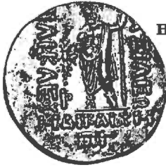
Heliokles (± 145-130 BC), AR Tetradrachme (16,33 g), buste n.r., staande Zeus met scepter.