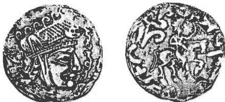
Khwarizmshah, Sawshafan, midden 8 e eeuw AD. AR drachme (2,94g) Koningshoofd/Ruiter.

De Turkse Karakhanieden dynastie omarmden omstreeks 999 de Islam en vervingen de Samaniden in Sainarkand en Buchara.