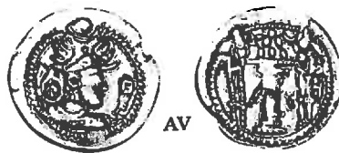
Hunnen. Na 800 AD. Opvolgers in India. AV Dinar (3,79g) Imitatie buste Peroz/Vuuraltaar.

Omstreeks 550 trok een confederatie van Turkse stammen vanuit Mongolië richting Centraal-Azië. Dit keer niet om te veroveren, maar om zich er te vestigen. Zij wisten de Heftalieten (Witte Hunnen) die in Sogdiana hun grondgebied hadden, te verslaan en vestigden het Turkse khaganaat. Daarbij kregen ze hulp van Sogdiërs die eerder door de Witte Hunnen naar het noorden waren verdreven.