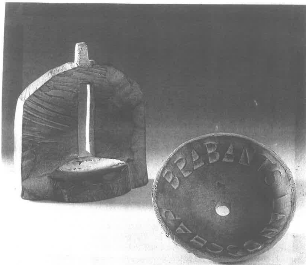
Boompenning, met afzonderlijke onderdelen

7 Karel Soudijn, Schijndel-penning van Jos Reniers, De Beeldenaar 21 (1997). p. 387-392.