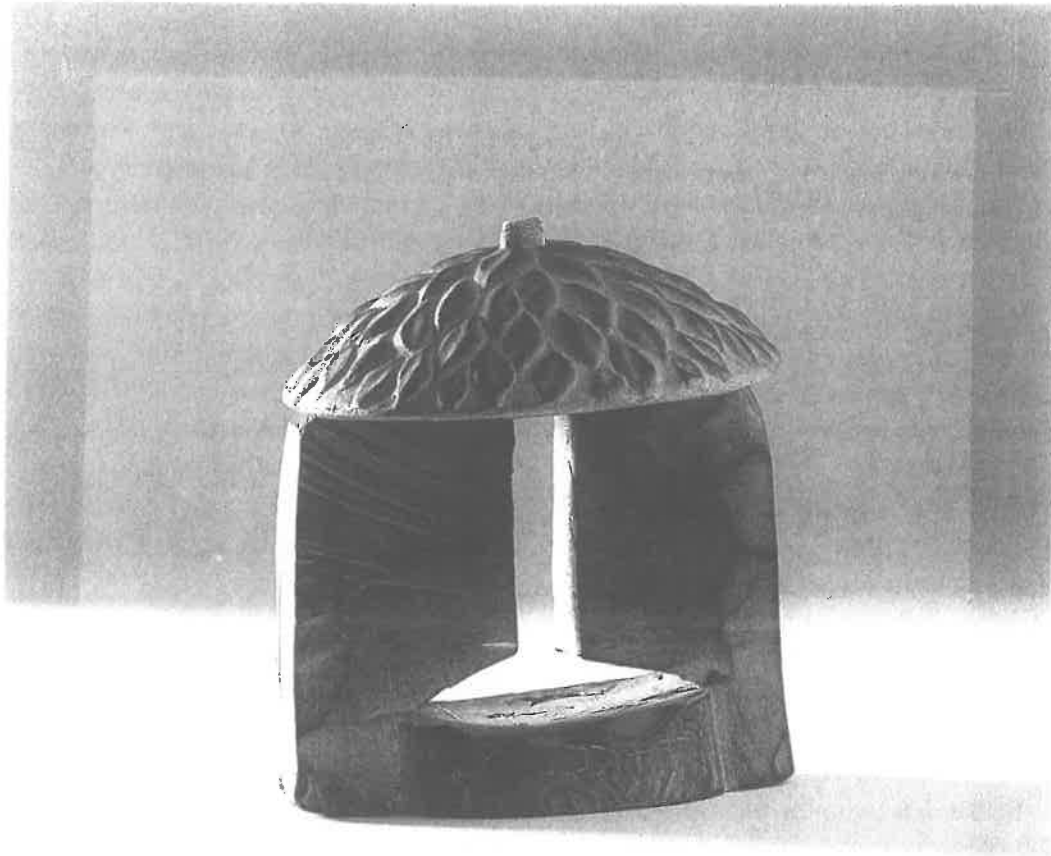
Boompenning, met bladerkroon op weggesneden stam

Van het onder (e) genoemde ontwerp liet Reniers foto's maken die hij eind 1994 gebruikte voor een kerst- en nieuwjaarskaart. Bovendien liet hij in 1995 twee exemplaren van deze Boompenning in brons gieten. Het onderstuk werd daarbij donker gepatineerd; de bladerkroon kreeg een lichtgroene patina. Van onderstuk tot topje is deze penning 95 mm hoog; het breedste gedeelte van het onderstuk meet 85 mm. De losse bladerkroon is 85 mm in doorsnee en heeft van de rand tot de top een hoogte van 25 mm.