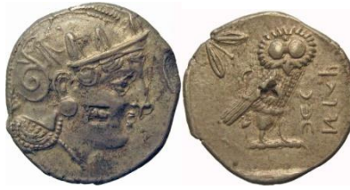
Attische tetradrachme, ca. 333 v. Chr. Vz. Hoofd van Athena met helm naar rechts. Klop op de wang. Kz.: Uil met olijftak, Aramese inscriptie, klop. 17,18g SNG 1

Onder de regering van Nectanebo II, de laatste “echte” farao van Egypte (360-342 v. Chr.), wordt voor het eerst een echt Egyptische munt geslagen. Op de voorzijde van zijn staters staan de hiërogliefen nbw en nfr: wat mooi of goed goud betekent. Dit heeft vermoedelijk te maken met de samenstelling van het goud. Op de achterzijde staat een paard. Men vermoedt dat deze munten zijn geslagen om het leger te betalen. Na de regering van Nectanebo II zullen alleen buitenlandse machten Egypte nog regeren. Allereerst komen de Perzen aan de macht, waarna in 332 v. Chr. Alexander de Grote de macht overneemt.