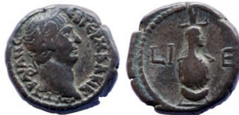
Trajanus, tetradrachme, 111/112

Type B is een atefkroon op een korte hoofddoek of khat . De vaas is gedrapeerd en versierd. Een grote bloemenkrans in U vorm hangt er rond. Dit type verschijnt voor het eerst onder Domitianus (90-91) en verdwijnt onder Antoninus Pius (143-144).