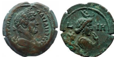
Hadrianus, diobool, 133/134.

Hij is ook de beschermer en heler van beten en steken van wilde dieren. Zijn munten zijn geslagen van Domitianus tot Diocletianus. Hij draagt bijna altijd de kroon van Opper- en Neder-Egypte op het hoofd, symbool van het koningschap. Wanneer hij een knuppel vasthoudt wordt hij geassocieerd met Heracles. Hij wordt ook op enkele nome-munten afgebeeld, zoals de Canopische nome. Hij had namelijk ook een connectie met de stad Canopus, dicht bij Alexandrië. Hij werd daar vereerd in een speciale gedaante: het bovenlichaam van een mens en het onderlichaam van een krokodil. Dit was het resultaat van een samensmelting tussen de krokodillengod Sobek en Harpocrates.