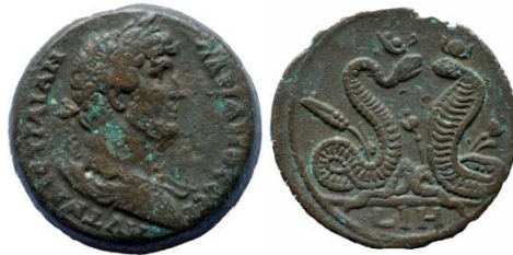
Hadrianus, drachme, 133/134.

De laatste twee figuren die we bespreken zijn Agathodaemon en uraeus. Agathodaemon is een goede geest of beschermgeest. Hij komt pas op in de Romeinse tijd en wordt aanzien als een goede geest die het huis beschermd en vruchtbaar land verzekerd. Hij wordt afgebeeld als een slang. Zijn vrouwelijke tegenhanger is Uraeus, de beschermende cobra (Wadjet in het Oude Egypte). Zij is al veel langer bekend in het Oude Egypte, als symbool en beschermgodin van Neder-Egypte. Samen met de gier (of Nechbet) stellen zij Opper- en Neder-Egypte voor. Zij worden vaak op het voorhoofd van de farao afgebeeld. De afbeelding van de godin Wadjet als cobra met een zonnescijf wordt Uraeus genoemd, wat later ook op de godin zelf gaat slagen. Zij werden niet alleen apart afgebeeld op munten, maar vaak ook samen.