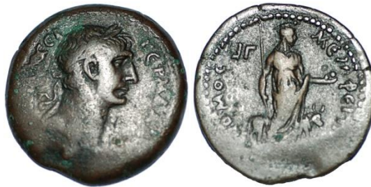
Trajanus, drachme, 109/110, Memphitische nome.

De goden zijn Egyptisch of Grieks, maar worden lokaal voorgesteld met een attribuut van de nome. Men is vrijwel zeker dat deze munten in de muntateliers van Alexandrië geslagen werden, om erna naar de desbetreffende nome verscheept te worden. Zij hebben meestal een lage denominatie, wat het vermoeden sterkt dat er geen grote bedragen verhandeld werden op het platteland van Egypte.