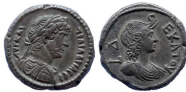
Hadrianus, tetradrachme, 125/126.

De personificatie van de stad Alexandrië werd Alexandria genoemd. Zij wordt meestal met een olifantenvel als hoofddekseel afgebeeld en houdt vaak een korenaar, krans of scepter vast. Daarnaast kan ze, als men wou benadrukken dat ze de stad zelf was, haar identificeren met Tyche en haar een kroon met torens aanmeten. Daarbij kon ze ook het beeld dat op de Pharos stond, in de handen houden of een roer. Tyche is de Griekse tegenhangster van Fortuna. Zij wordt geassocieerd met geluk en overleg. Niet alleen Alexandria, maar ook Isis werd geassocieerd met Tyche. Munten met haar beeltenis werden geslagen van Nero tot en met Diocletianus.