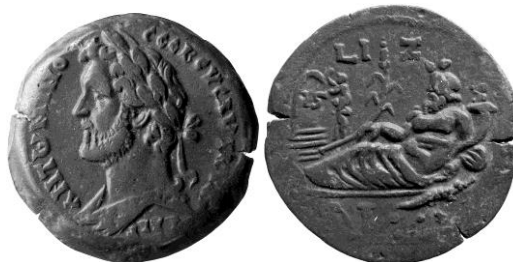
Antoninus Pius, drachme, 153/154.

Hij wordt afgebeeld als een man met een baard, ligt meestal neer zoals de meeste riviergoden en houdt vaak een hoorn des overvloeds vast. Rondom hem staan vaak krokodillen of nijlpaarden, die in de Nijl leefden. Hij houdt een lotusbloem of riet in de handen. Zijn munten zijn geslagen van Galba tot en met Claudius II Gothicus.