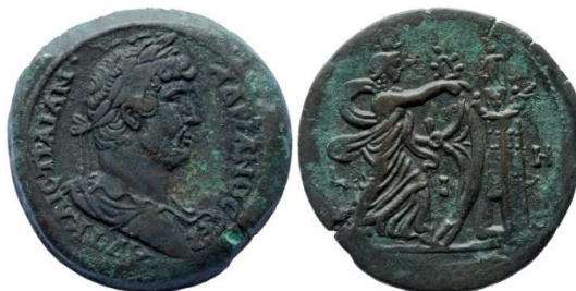
Hadrianus, drachme, 133/134.

Isis werd aan de haven van Alexandrië gelinkt als Isis Pharia (Isis van de vuurtoren). Hierbij houdt ze vaak een zeil vast, zodat de schepen veilig naar de haven zouden varen. Dit type werd geslagen van Caracalla tot Marcus Aurelius.