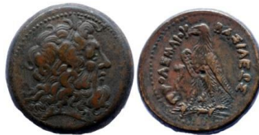
Ptolemaios III Euergetes (246-211 v. Chr.), tetradrachme. Vz.: Hoofd van Zeus Ammon met diadeem. Kz.: PTOLEMAIOU BASILEWS, adelaar op bliksem naar links. Cornucopia. 34,11g. SNG 95

Wanneer na de dood van Alexander de Grote Ptolemaios I aan de macht komt, één van zijn generaals, wordt Egypte een Hellenistische staat. Ptolemaios en zijn opvolgers gaan zeer snel munten beginnen te slaan en voor het eerst worden ze ook frequent aangemunt.