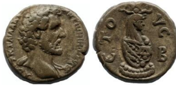
Antoninus Pius, tetradrachme, 138/139.

Type A is een kroon met twee hoge struisvogelveren op ramshoorns. Deze kroon wordt de andjity-kroon genoemd, naar de god Andjity, de voorloper van Osiris. Het is een kroon met aan de buitenkant een uraeus, gedragen op een driedelige priuk. De vaas is rijkelijk versierd met een naos, geflankeerd door goden en een gevleugelde scarabee. Dit type wordt van Galba tot Gallienus geslagen.