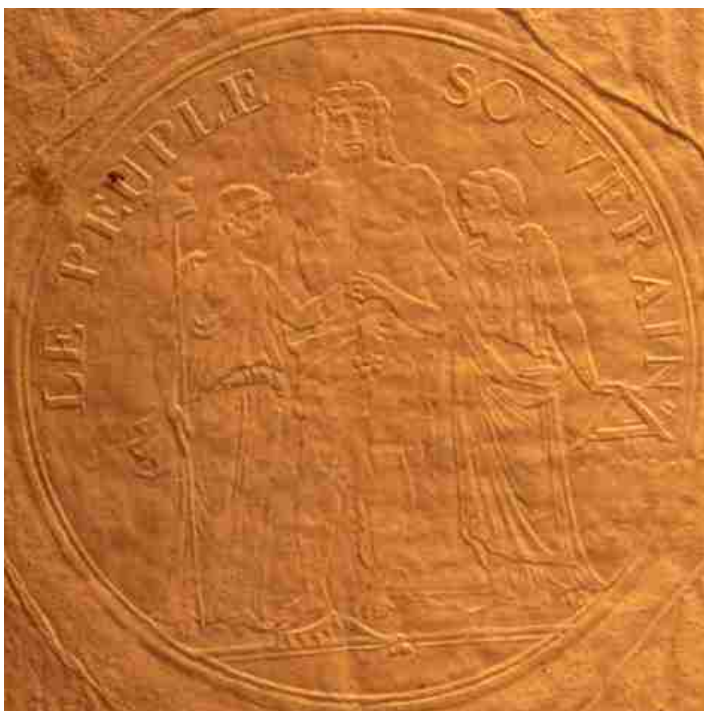
Droge stempel met Hercules, de Vrijheid en de Gelijkheid