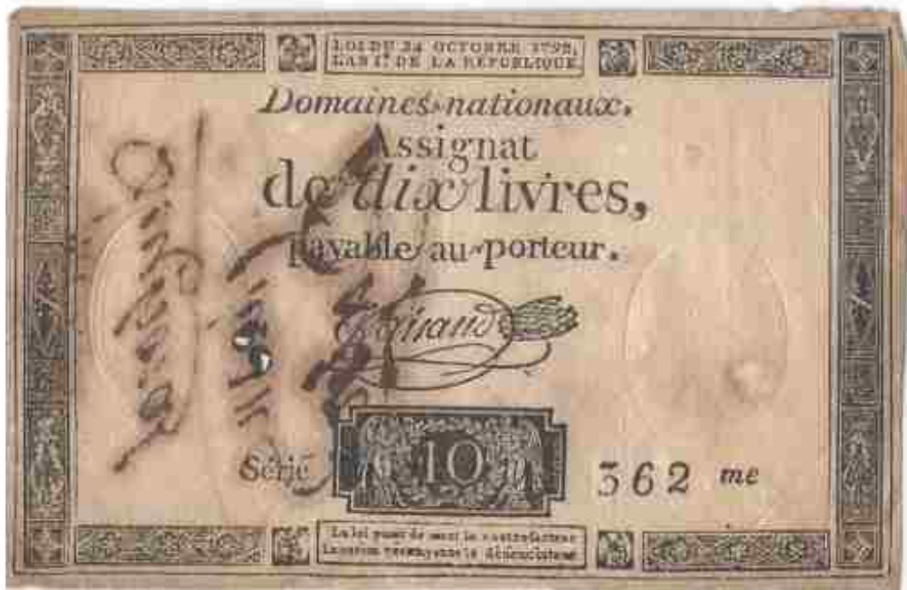
Vals assignaat van 10 livres