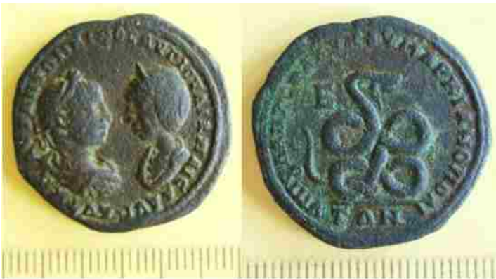
Marcianapolis Elagabalus & Julia Maesa