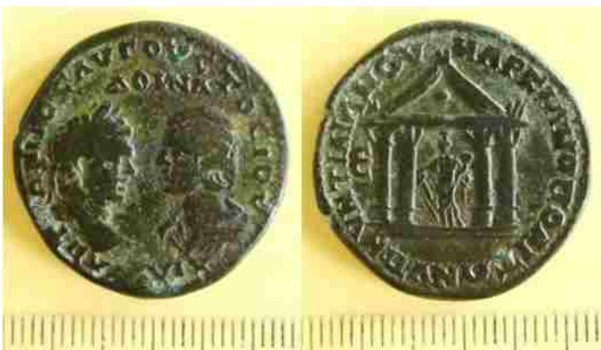
Marcianapolis. Caracalla & Julia Domna